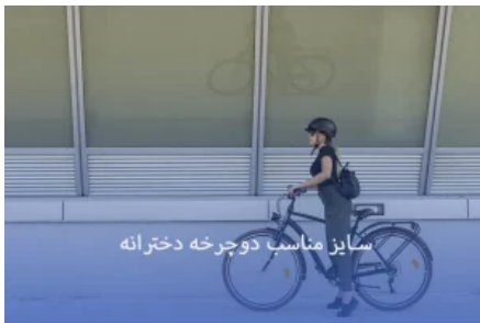
سایز مناسب دوچرخه دخترانه

دوچرخه آموزشی: معمولا دوچرخه‌های دخترانه آموزشی مناسب کسانی است که تازه شروع به یادگیری دوچرخه سواری کردند و حفظ تعادل برایشان دشوار است. این محصولات در واقع به غیر از دو چرخ اصلی دوچرخه دارای دو چرخ اضافه نیز هستند. شما می‌توانید بعد از مسلط شدن کودکانتان بر مهارت حفظ تعادل با دوچرخه، دو چرخ اضافی و کمکی را جدا کنید