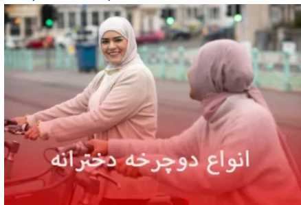
انواع دوچرخه دخترانه

یاد ایام بچگی بخیر خیلیمون دوتا چرخ کمی میذاشتیم که بتونیم پایدان بزنیم و کم کم چرخ هارو درمیاریم خیلی هم زمین میخوریم با تمام زمین خوردنا لذت خاصی داشت و خاطره خیلی خوبی برای هممون شد بدون شک یکی از وسایلی که بیشتر افراد در دوران کودکی با آن خاطره دارند، دوچرخه می باشد. دوچرخه در دسته وسایل بازی پرتعداد است که حتی گذشت زمان از محبوبیت آن نیز کم نمی کند و هنوزم که هنوزه بهترین هدیه برای دختران و پسران محسوب می شود. امروزه دوچرخه های دخترانه در تنوع و سبک های مختلف در بازار وجود دارند که همین امر سبب شده خریداران این وسیله با چالش بزرگی روبهرو شوند و نتوانند به راحتی انتخاب مناسبی داشته باشند. آیا شما نیز در هنگام خرید دوچرخه دخترانه با این مشکل مواجه شدید؟ . اگه دانش این رو ندارید که چگونه از اینترنت دوچرخه خرید کنید حتما روند خرید اصولی دوچرخه رو مطالعه بفرمایید . اگر شما نیز با این مشکل روبهرو شدید حتما تا پایان این مطلب با ما همراه باشید. در ادامه فروشگاه دوچرخه بوتنا هر آنچه را که نیاز است در مورد دوچرخه های دخترانه بدانید در اختیار شما قرار می دهد.