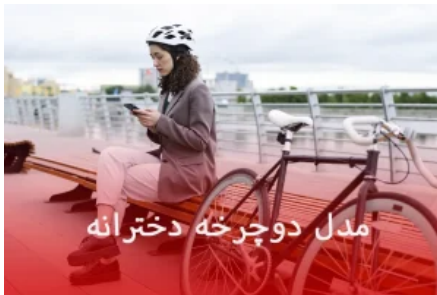
مدل دوچرخه دخترانه

یکی دیگر از سوالات رایجی که ممکن است در هنگام خرید دوچرخه با آن روبه‌رو شوید این است که چه سایز دوچرخه‌ای مناسب کودکان شما است؟ خوشبختانه امروزه دوچرخه‌ها دارای سایز و ابعاد بسیار مختلفی هستند و شما می‌توانید با توجه به قد و جثه کودکان بهترین و مناسبترین سایز دوچرخه را انتخاب کنید. سایز دوچرخه‌های بچگانه بین 12 تا 24 است . تصور کنید شما دختر خانمی هستید با قد 175 پس شما نمیتونید دوچرخه با سایز 16 سوار بشید . اگه بهترین مارک دوچرخه متناسب با بودجه خودتون دوست دارید تهیه کنید خوب جایی اومدید . دوچرخه تون باید متناسب با قد و هیكل شما باشه که بتونید بهترین بهره رو ببرید . تصور کنید توی هوای بهاری بتونید تو فضای سبز پارک با استایل خوشگلتون از این موقع فصل و این هوای خوب لذت ببرید و رنگ دوچرخه با رنگ لباس شما ست باشه . و تنها چیزی که صورت شما میخوره نسیم خنک بهاریه که حال شما بهتر میکنه . تصور کن کنج خونه نشستی و حالت بده و فضای خونه بهت احساس خفگی میده . با دوچرخه سواری حس و حالت رو عوض کن برو جاهای دیدنی شهرتون تو فضای باز و آزاد حالت بهتر میشه و میتونی تصمیم های بهتر بگیری و به خودت کمک میکنی که حال خوبت حفظ بشه . و باعث میشی حس و حال بد رو از خودت دور کنی . شاید فکر کنید آموزش تعویض لنت ترمز دیسکی دوچرخه خیلی کار سختیه اما با انجام دادن چند مرحله ساده اون رو یاد بگیر و صدمات احتمالی جلوگیری کن .